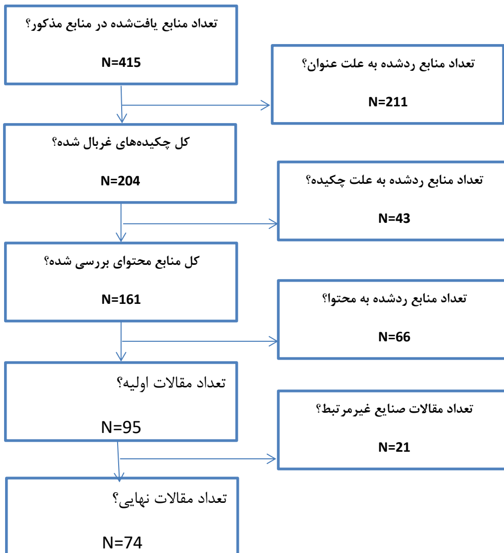
شکل ۱. خلاصه‌ای از فرآیند فیلتر مقالات