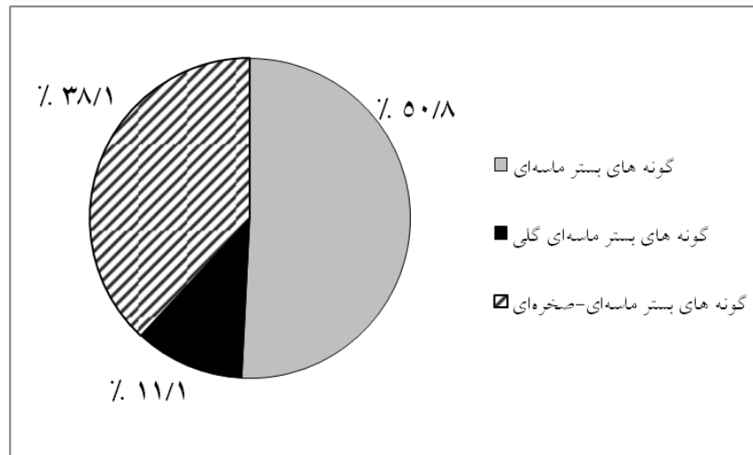
شکل ۲. درصد گونه های مشاهده شده در هر ساختار ژئومورف نسبت به مجموع گونه های مشاهده شده در ساحل شمال جزیره قشم.